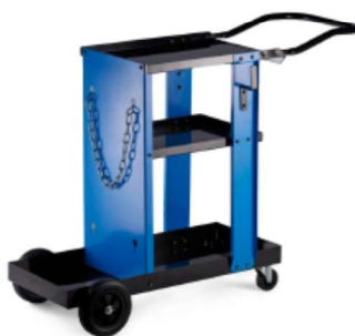
ポンベ搭載型台車 (オプション) S サイズ 長さ 980mm まで 2m 3 W4011502