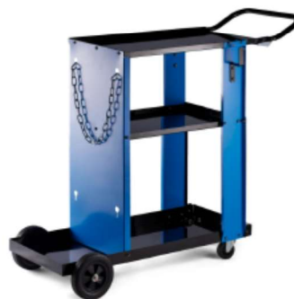
ポンベ搭載型台車 (オプション) L サイズ 長さ 1250mm まで 7m 3 W4011504

お問い合わせはこちらから TEL: 046-281-5885 MAIL: exceed@exceeds.co.jp